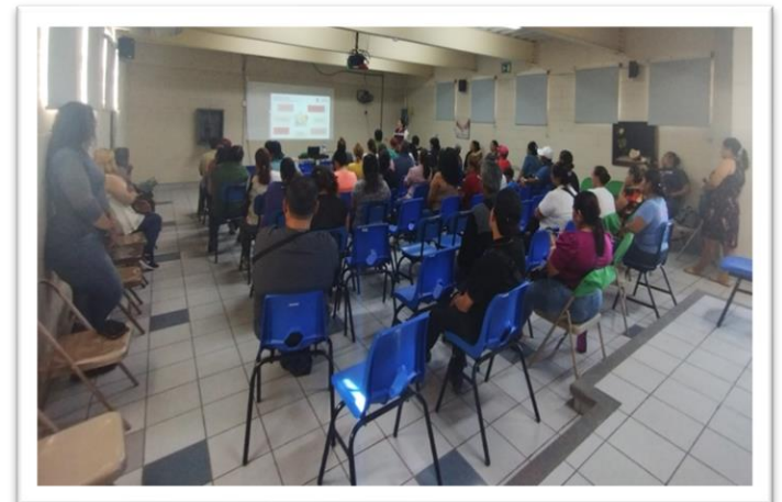
Escuela para las Familias, Plática: "Como Hablar de Sexualidad con Hijas e Hijos", Tijuana, Baja California