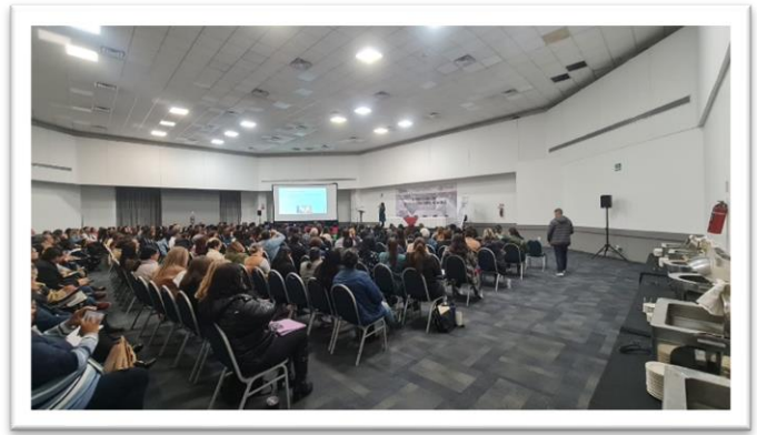
Foro de los derechos sexuales y reproductivos para adolescentes de 10 a 14 años de edad, Tijuana, Baja California.