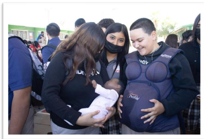
Feria de servicios, Centro de Bachillerato Tecnológico Agropecuario No 41, Mexicali, Baja California