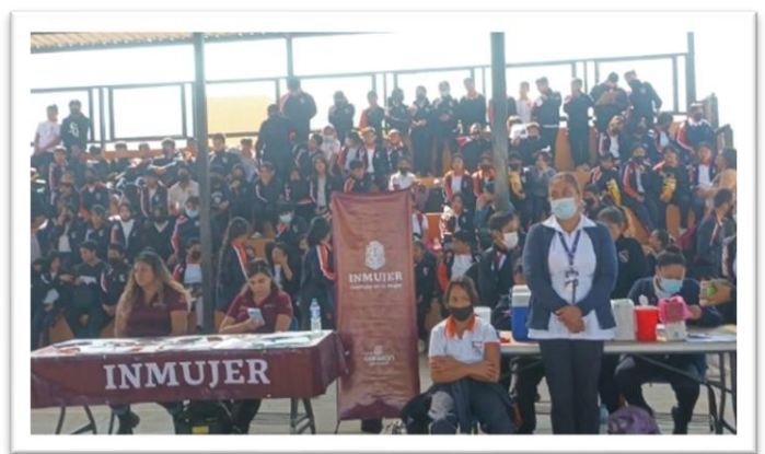
Feria de Salud en la Comunidad del cañón Buenavista Secundaria Benito García, Ensenada, Baja California