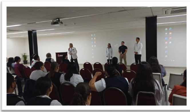
Capacitación en temas de SSRA, Ensenada, Baja California