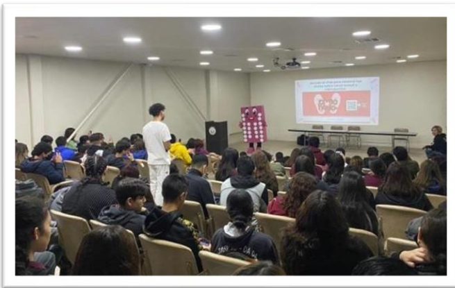
Activación presencial del Código QR del Chat ¿Cómo le hago? con alumnado del CETIS 18, Centro de Salud Santa Isabel, Mexicali, Baja California